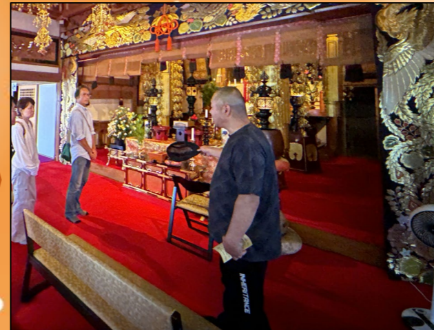
⑤住職さんから、お寺の説明を受けました。さまざまな彫刻、お寺の歴史(1000年!)は聞かないと気づきません。塩尻にこんな立派なお寺さんがあることを知らなかったとは!!