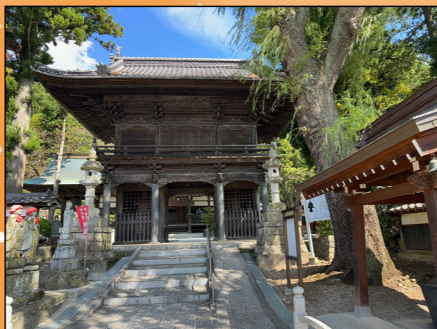
④永福寺。立派な山門には、仁王像があります。阿(あ)吽(うん)の向きが逆なのは珍しいそうです。