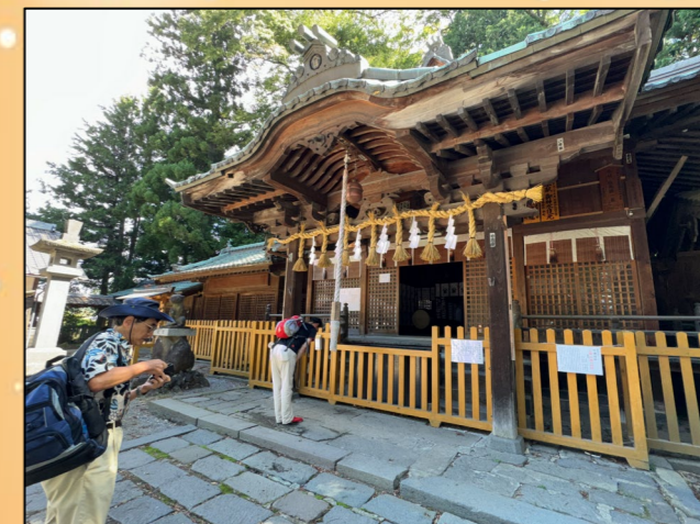
③阿礼神社。木陰が涼しい。必勝祈願の神様なので、しっかりとお参りました。