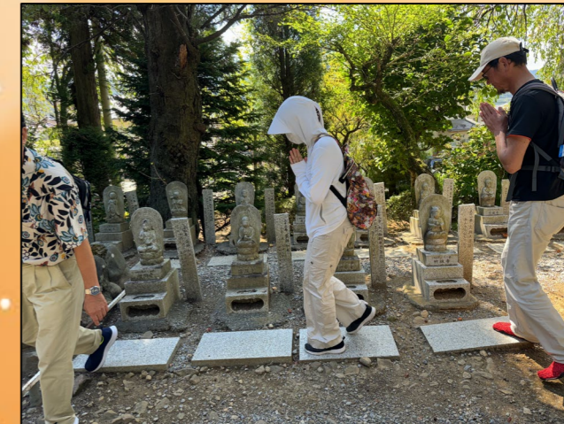
⑥四国八十八箇所お砂踏み。四国に行かずとも、ここでお遍路巡りの御利益があるとのこと。忙しい現代人には、タイプ半端ないですね。