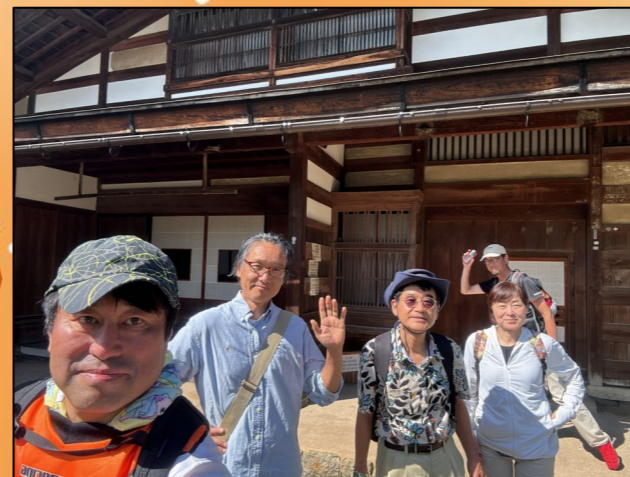
②堀内家住宅。立派な古民家にびっくり! 予約をすれば中も見ることができるそうです。