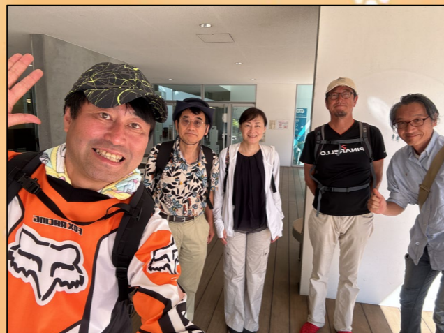
①えんぱーくを出発、爽やかな秋晴れです。