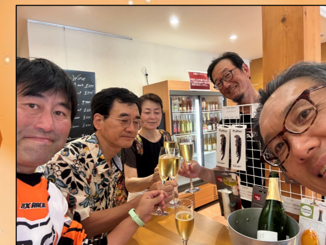
⑨もちろん、最後はワインで乾杯です! スパークリングワインは乾いた喉を潤します。さまざまな種類のワインが試飲できて満足です。