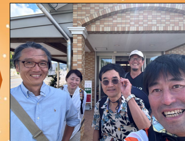
⑧サンサンワイナリー着! ここまで、えんぱーくから約5km。秋空のもと、歩いてきました。歩かないと見えない景色がいっぱいです。