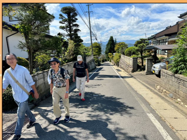
⑦柿沢の急坂を登りサンサンワイナリーまで、とても急な坂道で、体力が必要です。みどり湖SAを上から眺められるのは面白かった。