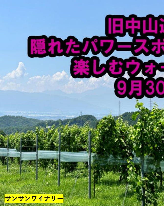
サンサンワイナリー