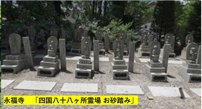
永福寺 「四国八十八ヶ所霊場 お砂踏み」